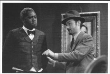
VERFAILLE, J., "Les Brumes de Manchester" in Le Courrier de Saint-Pierre, n°4, juin-juillet-août 2005, Bruxelles, pp. 27-29